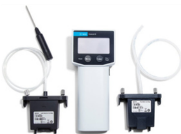
FLUJOMETRO / DETECTOR DE FUGAS