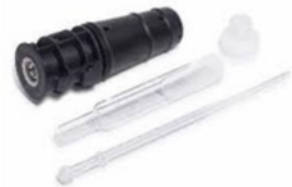
ANTORCHA INERTE DESMONTABLE