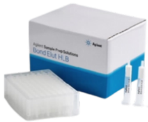
BOND ELUT HLB