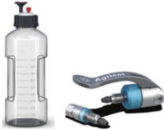
A-LINE CONEXIONES Y TAPONES