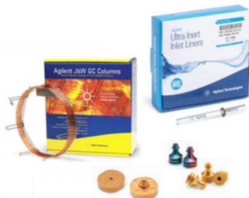
RUTA GC ULTRA INERTE